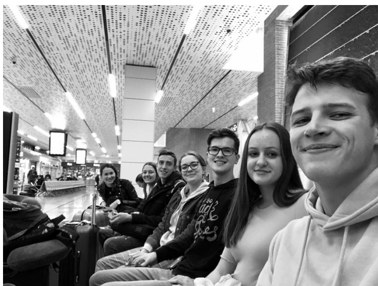
Skupina na poti v Španijo