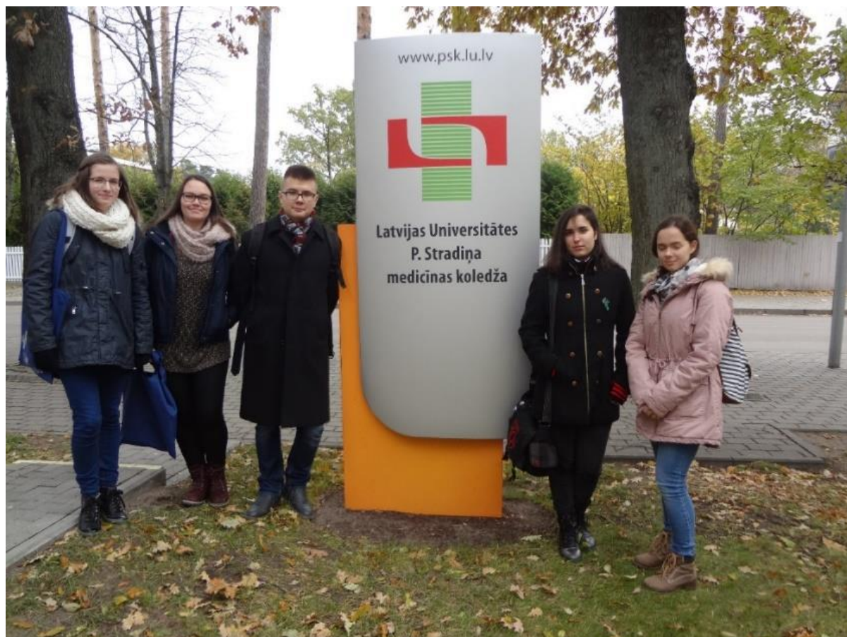
Dijaki na praksi v Latviji.

Iz vseh treh španskih šol so prišli učitelji in dijaki tudi v Ljubljano. SŠFKZ je omogočila spoznavanje šolskega dela in utrjevanje prakse trem dijakinjam programa kozmetični tehnik iz šole Las Indias (27. 3.–28. 4. 2017), trem dijakinjam programa kozmetični tehnik iz šole College No.1 (27. 3.–26. 5. 2017) in dvema dijakoma programa farmacevtski tehnik iz šole Los Gladiolos (17. 4.–8. 5. 2017). V Ljubljani so delali in se izobraževali od treh tednov do dveh mesecev.